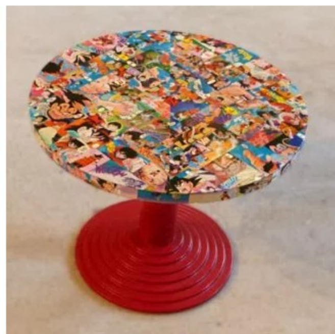
Fauteuil crapaud en tissu imprimé Natalia, 279,99 €. www.vente-unique.com Table manga, 110 €. www.art2co.com