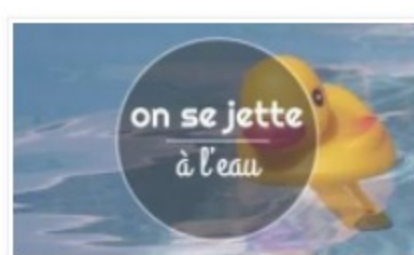
On se jette à l'eau 1 juin 2016 Dans "Atmosphère"