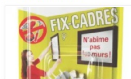
Fix-cadres ton humeur 30 mai 2014 Dans "News"