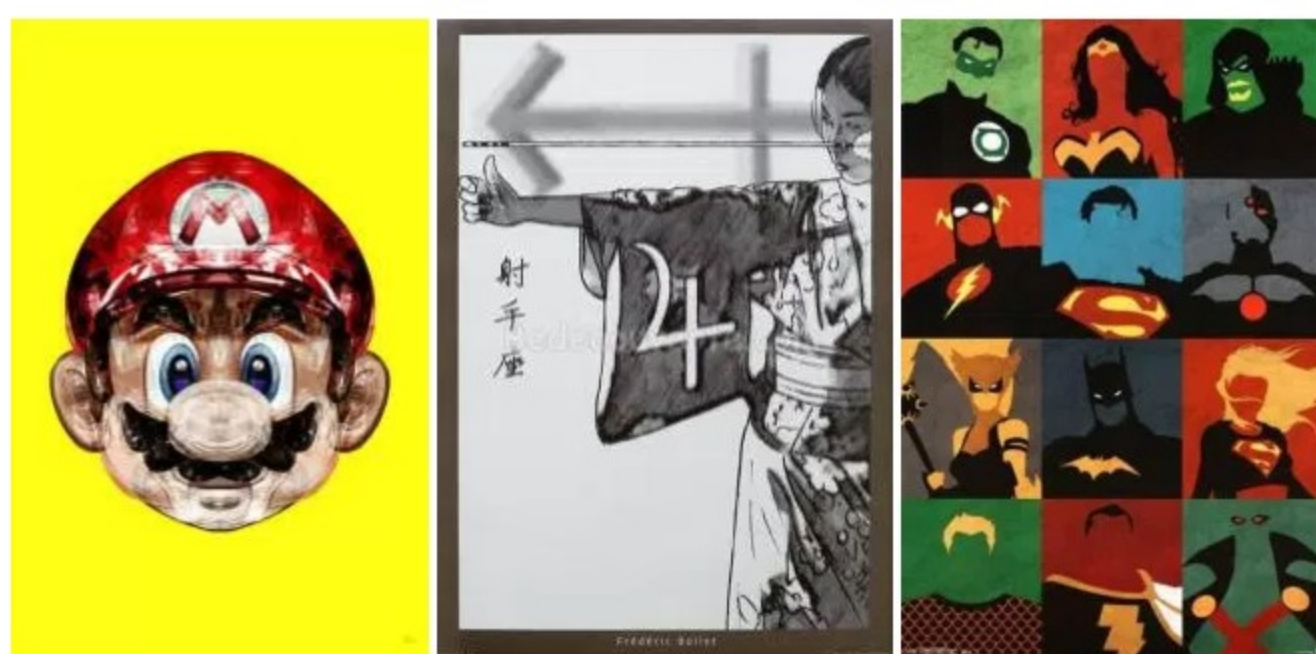
Super Plombier, 40 x 60 cm, 24,90 €. www.junique.fr Vierge Virgo de Boilet, éditée en 1000 Exemplaires 50x70 cm, 8,90 €. www.bedecouverte.com Justice League - Minimalist, 56 x 86 cm, 6,99 €. www.allposters.fr

Tableaux, cadres... sont les plus simples à insérer dans votre décoration intérieure. En effet, ils apportent un véritable plus sans être intrusif. De plus, ils se marient avec tous les styles. Bien sûr, on évite les affiches juste collées aux murs, mais également les sous-verres. On préfère les cadres noirs ou en bois pour leur donner un côté raffiné, plus moderne mais surtout plus adulte.