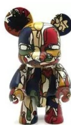
Assassin's Creed Origins, 59,99 €. www.micromania.fr Fusée Tintin, 149 €. boutique.tintin.com Qee customisé par Cy Wilson. Boîte entièrement décorée, 900 €. artoz.com