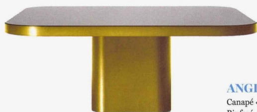
Table basse « Bow No. 6 » de Guilherme Torres en laiton, plateau en verre, L 100 x P 37 x H 70 cm, 2 430 €, ClassiCon chez Silvera.