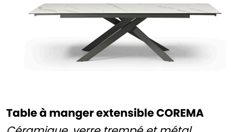
Table à manger extensible COREMA

Tissu bouclette OEKO-TEX® et bois L. 130 x H. 67 x P. 87 cm 589,99 €